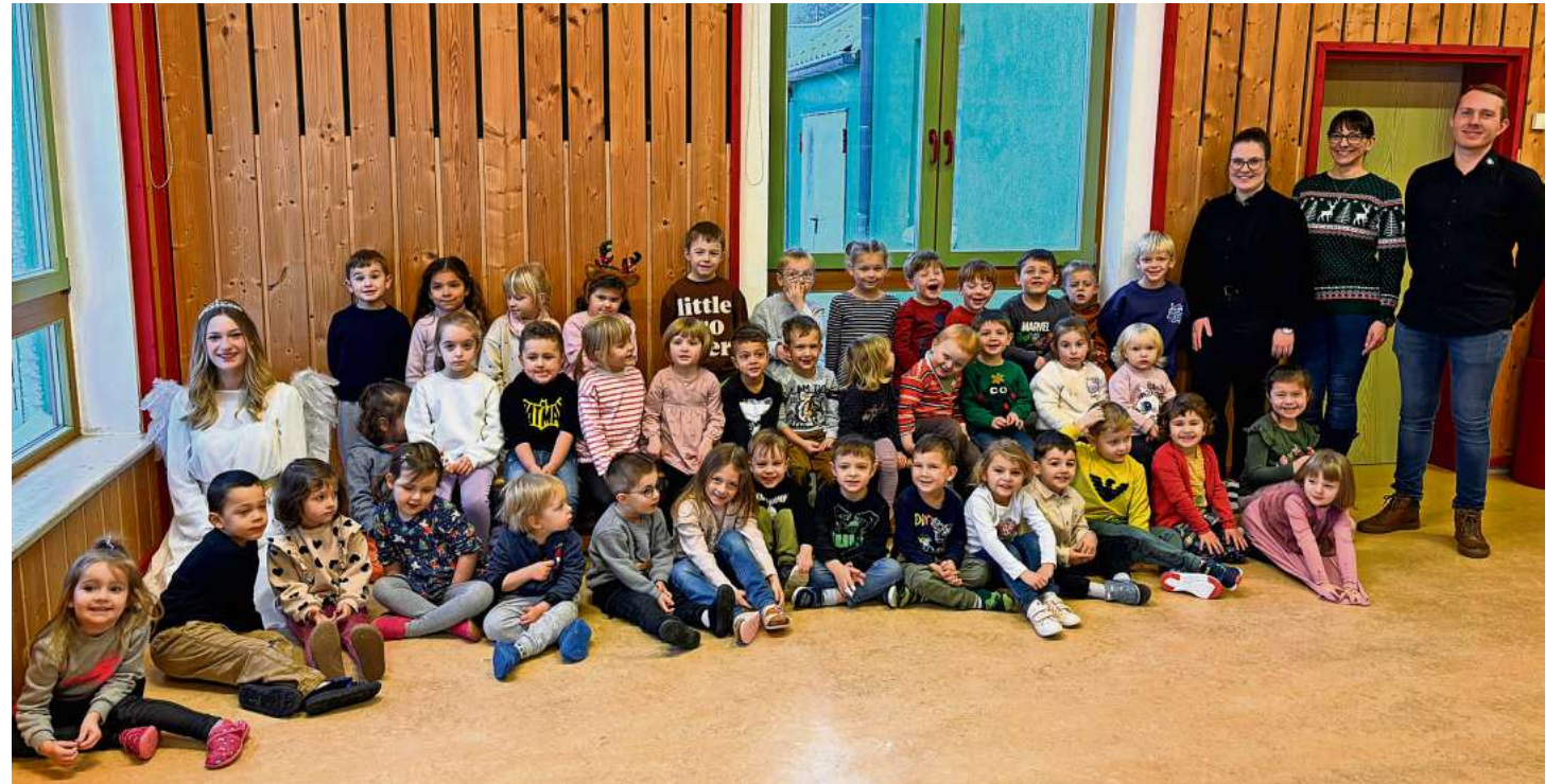
Die Kinder aus dem Kindergarten Regenbogen Tettau verbrachten einen schönen Vormittag mit dem Christkind.

Auf einen Tanz mit dem Christkind: Die Kinder hatten auch etwas für das Christkind vorbereitet und sangen ihm ein Lied, inklusive einstudierter Choreografie, vor.